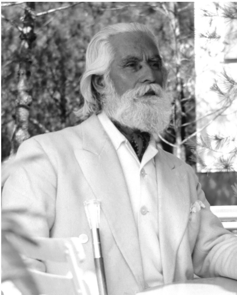
Omram Mihael Ajvanhov